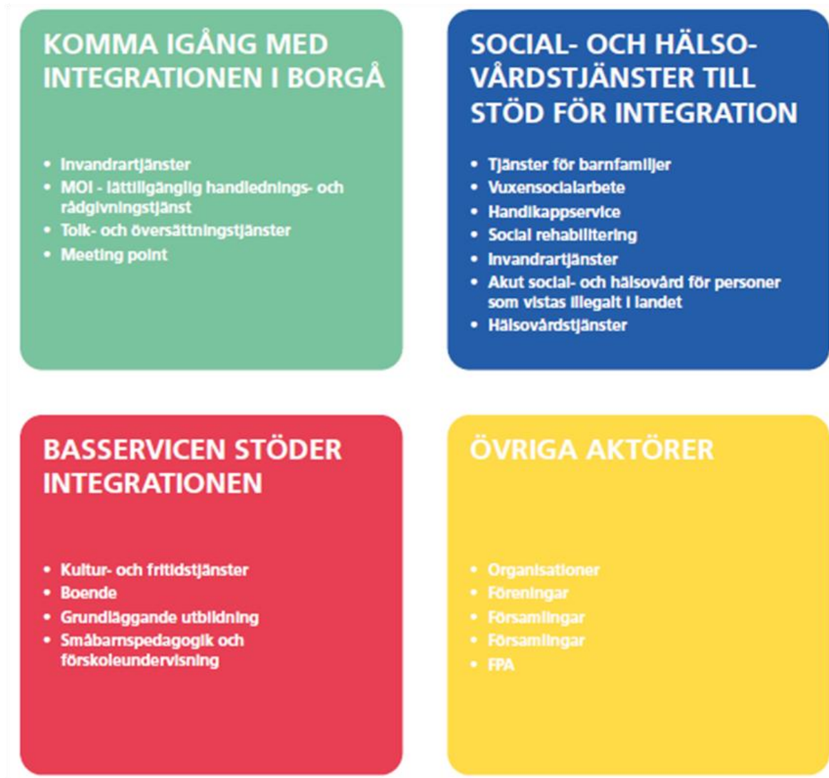
Figur 1: Borgås tjänster till stöd för integration (Borgå stad 2022, s. 8)

I Borgå stads Program för att främja invandrares integration 2022–2024 delas tjänsterna till stöd för integration i fyra grupper (figur 1):